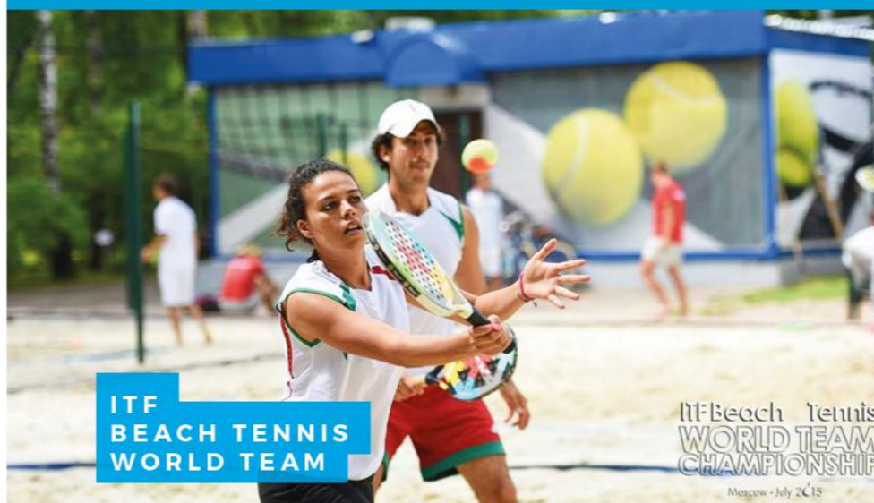
ITF BEACH TENNIS WORLD TEAM

Pour y parvenir, la promotion du Beach-Tennis au niveau national est essentielle pour l'élargissement de la base des pratiquants à travers des journées d'initiation et de vulgarisation qui auront pour objectif de faire découvrir la discipline, la création d'un circuit national destiné aux jeunes de - 15 ans, aux adultes et aux vétérans. Au niveau international, le Maroc continuera à organiser des tournois de grande ampleur censés attirer les meilleurs joueurs mondiaux et apporter plus d'expérience à nos joueurs.