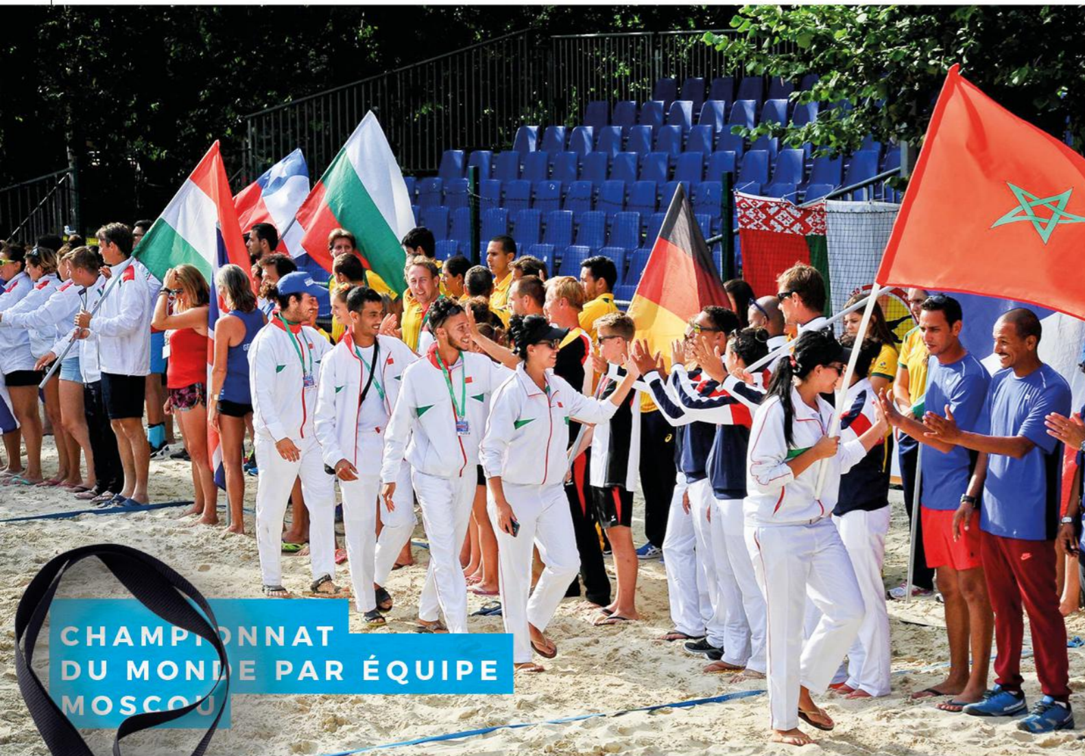
CHAMPIONNAT DU MONDE PAR ÉQUIPE MOSCOU