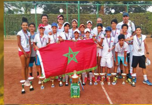
CHAMPIONNAT ARABE DES 11 - 12 ANS. LE MAROC SACRÉ CHAMPION ARABE AVEC 7 TITRES SUR 12.